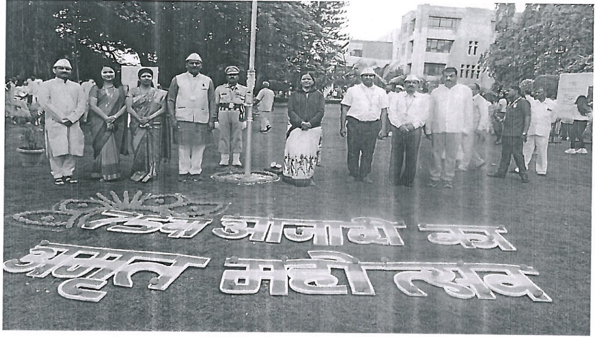
Flag Hosting on 15/08/2022