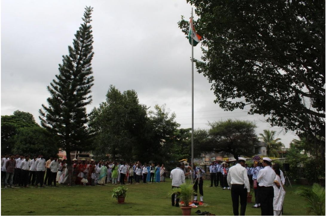
दिनांक १५ ऑगस्ट या दिवशी महाविद्यालयामध्ये ध्वजारोहण समारंभ