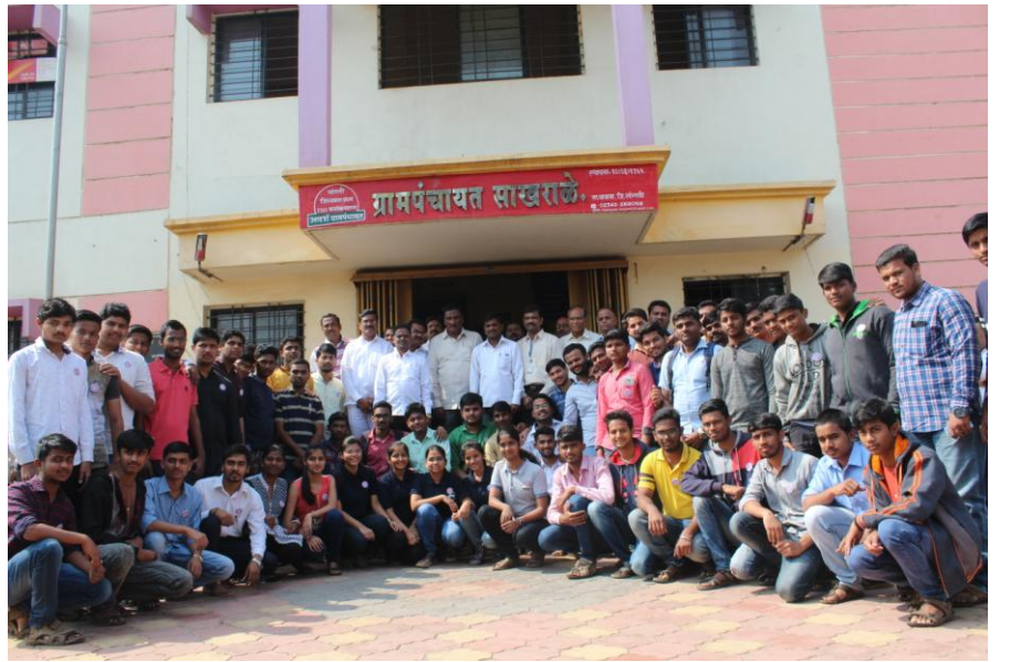
शिबीरामधील सहभागी विद्यार्थी प्रमुख मान्यवरांसमवेत