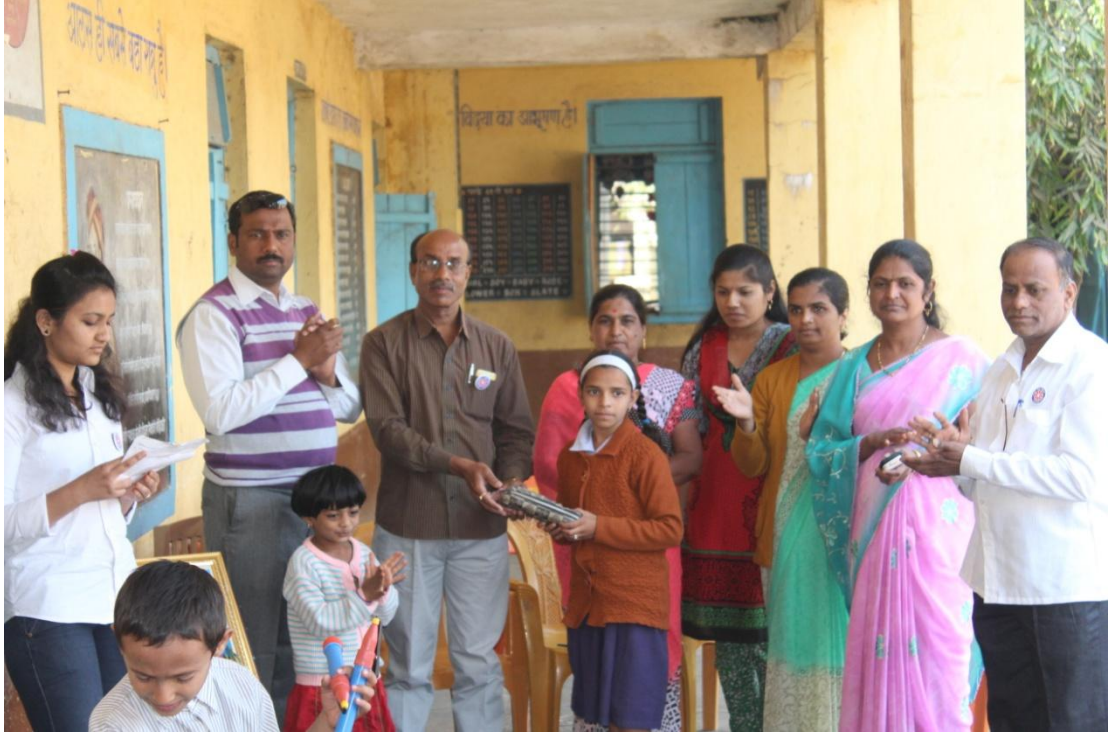
साखराळे येथिल जिल्हा परिषद शाळेमधील विद्यार्थ्यांमध्ये विविध स्पर्धा आयोजित केलेल्या त्या स्पर्धामध्ये विजयी झालेल्या विद्यार्थ्यांना बक्षिस प्रदान करताना शाळेच्या शिक्षिका, कार्यक्रम अधिकारी व एन.एस.एस.चे स्वयंसेवक