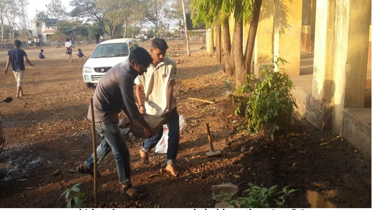
ग्रामस्वच्छता मोहिमेअंतर्गत श्रमदान करताना रा.से.योजनेचे स्वयंसेवक विद्यार्थी ठिकाण — जिल्हा परिषद शाळा परिसर, साखराळे