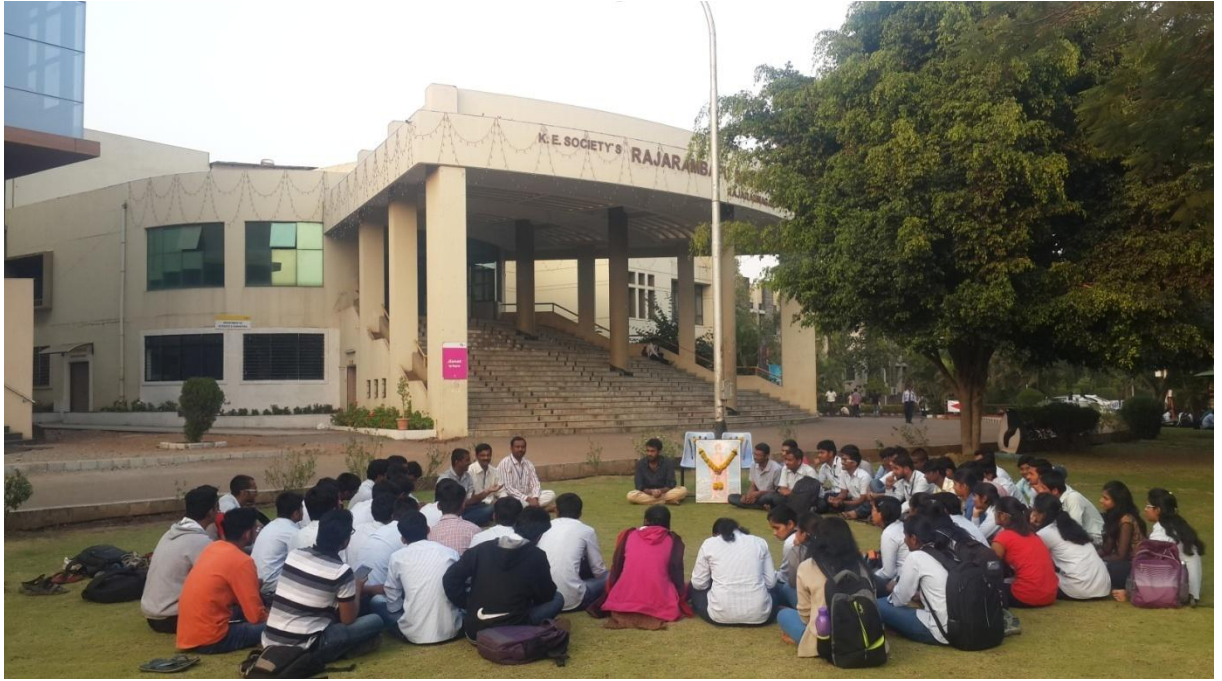
'राष्ट्रीय युवा दिन' निमित्त आयोजित चर्चासत्र