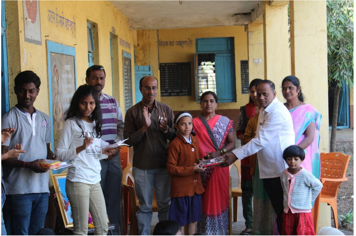
क्रांतीज्योती सावित्रीबाई फुले यांच्या जयंती निमित्त जि.प.साखराळे येथील विद्यार्थ्यांना शैक्षणिक साहित्याचे वाटप करण्यात आले