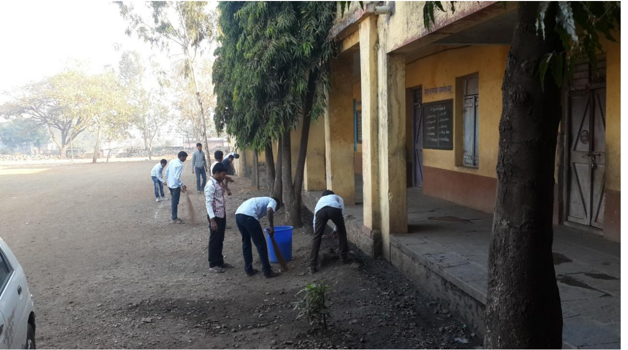
साखराळे येथिल जि.प.शाळा परिसरामध्ये स्वच्छता करताना स्वयंसेवक