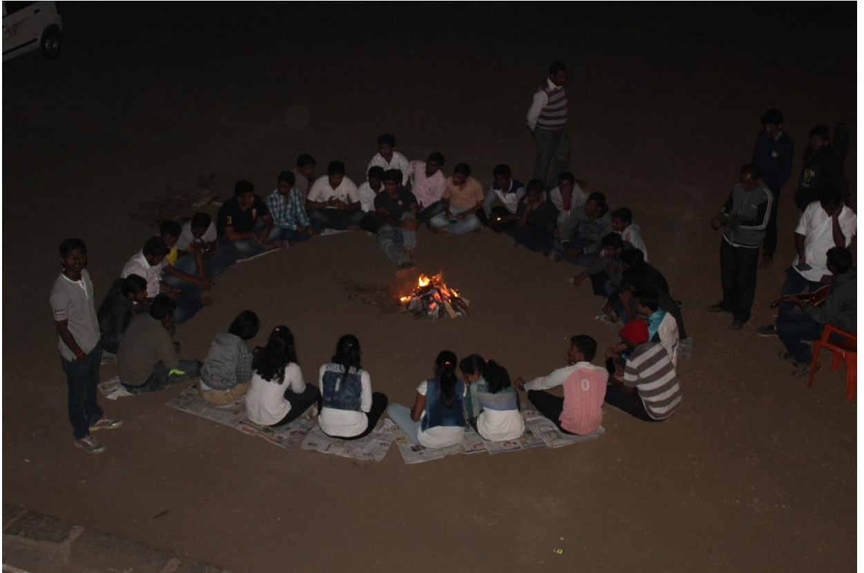
शिबीर कालावधीमध्ये शेकोटी व सांस्कृतिक कार्यक्रमाचे वेळी त्याचा आनंद घेताना एन.एस.एस.चे स्वयंसेवक