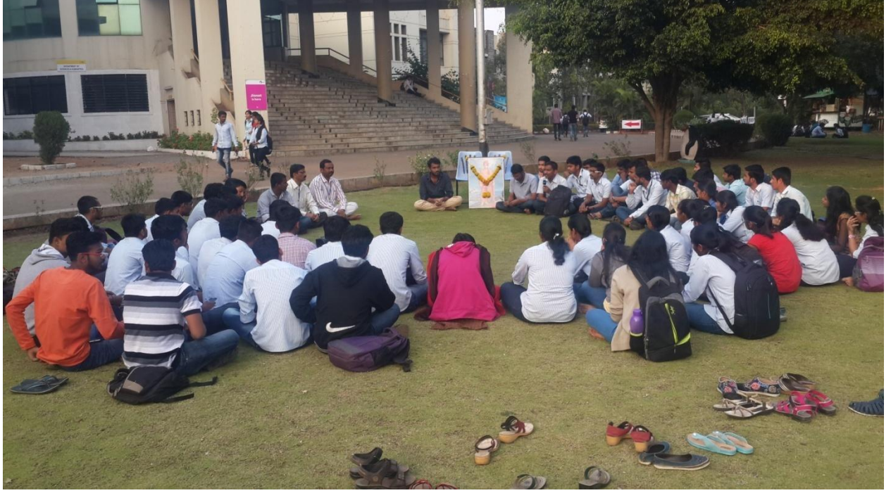
स्वामी विवेकानंद यांची जयंती म्हणजेच 'राष्ट्रीय युवा दिन' निमित्त चर्चासत्रामध्ये सहभागी विद्यार्थी