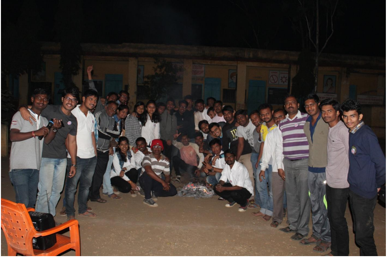
साखराळे येथे शिबीरादरम्यान शेकोटी वेळी एन.एस.एस.चे स्वयंसेवक