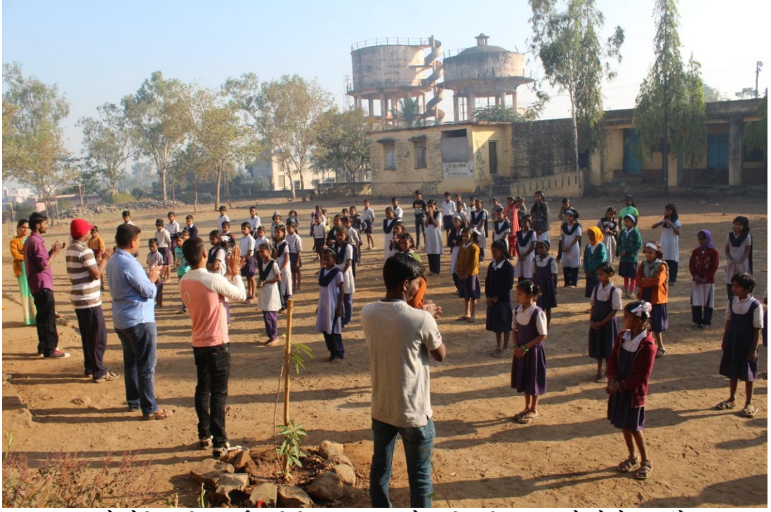
साखराळे येथिल विद्यार्थ्यांना विविध कला व खेळ शिकविताना रा.से.यो.चे स्वयंसेवक