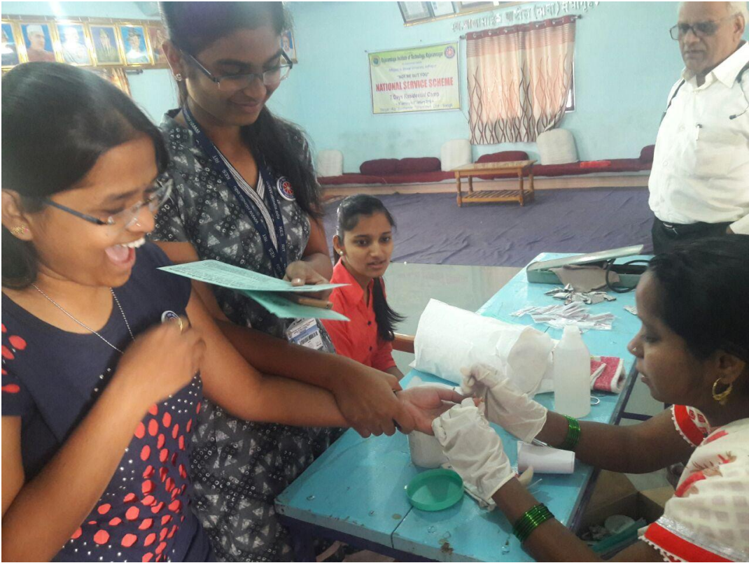
महिलांचे आरोग्य तपासणी शिबीरामध्ये हिमोग्लोबिन तपासणी करताना