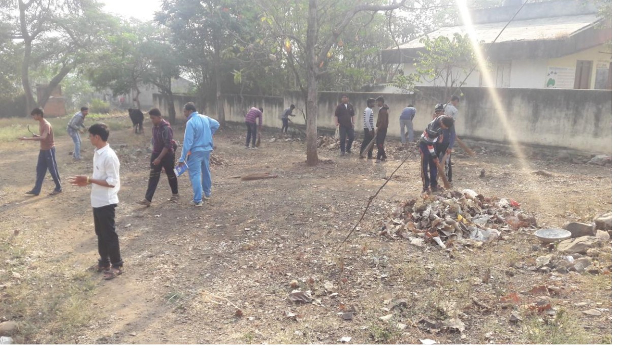
साखराळे येथिल पाण्याची टाकी परिसरामध्ये स्वच्छता व श्रमदान करताना स्वयंसेवक