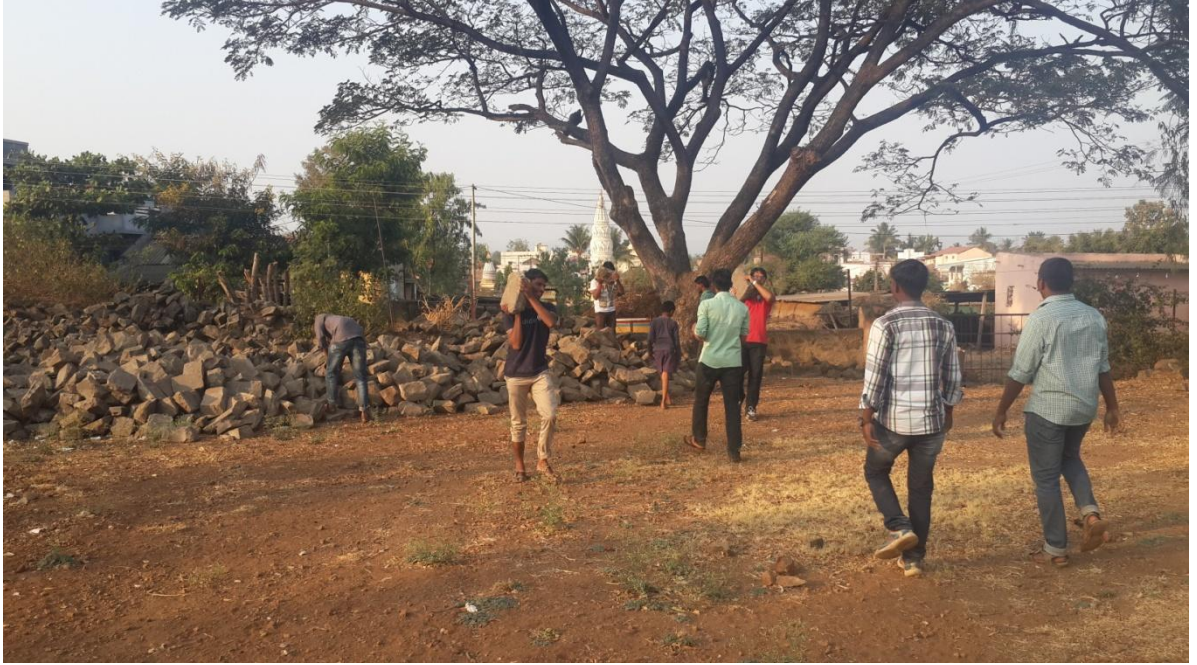
ग्रामस्वच्छता मोहिमेअंतर्गत श्रमदान करताना रा.से.योजनेचे स्वयंसेवक विद्यार्थी ठिकाण — जिल्हा परिषद शाळा परिसर, साखराळे