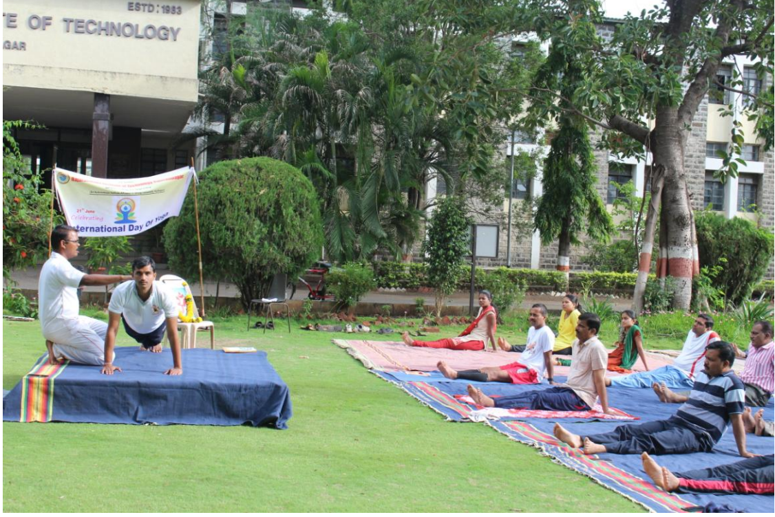
दिनांक २१ जून २०१७ तिसरा आंतरराष्ट्रीय योग दिनानिमित्त आर.आय.टी. मध्ये योगासनांचे प्रात्यक्षिक सादर करताना उपस्थित उपस्थित शिक्षक व विद्यार्थी