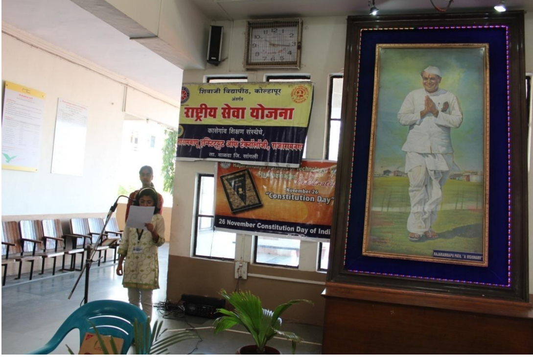
दिनांक २६ नोव्हेंबर २०१७ रोजी संविधान दिनानिमित्त “संविधानाचे वाचन”