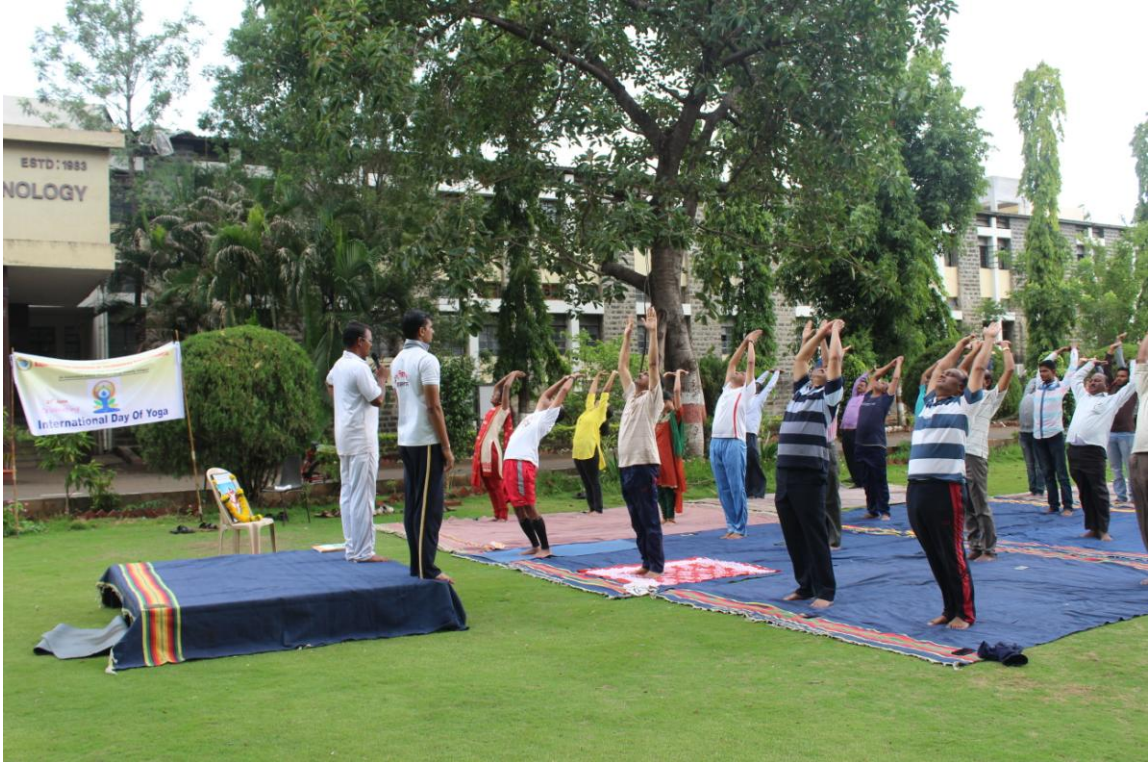
दिनांक २१ जून २०१७ तिसरा आंतरराष्ट्रीय योग दिनानिमित्त आर.आय.टी. मध्ये योगासनांचे प्रात्यक्षिक सादर करताना उपस्थित शिक्षक व विद्यार्थी